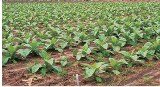
Առավել տարածված տեխնիկական մշակարույսը ծխախոտն է

մարզերի չոր մերձարևադարձային կլիմայական պայմաններում մշակում են մերձարևադարձային պտուղներ: Արարատյան դաշտում, Վայոց Ձորի, Սյունիքի, Լոռու և Տավուշի մարզերի ցածրադիր գոտիներում և միջին բարձրություններում (մինչև 1400-1500 մ) մշակում են կորիզավորներ և ընկուզապտուղներ: Բարձրադիր գոտիներում (1500-2100 մ) հիմնականում մշակում են հնդավորներ (խնձորենի, տանձենի):