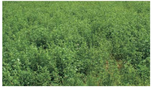
Առվույզը տարածված կերային մշակաբույս է