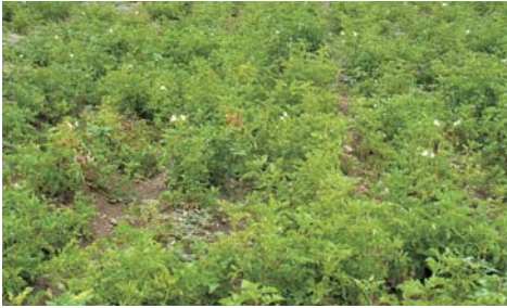
Կարտոֆիլի ցանքերը տարածված են ամենուրեք