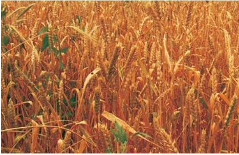
Հացահատիկային հիմնական մշակարույսը աշնանացան ցորենն է