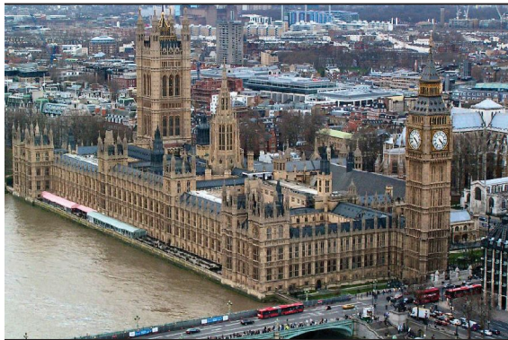
Վեստմինսթերյան թագավորական պալատը

Պետական կարգը՝ սահմանադրական միապետություն