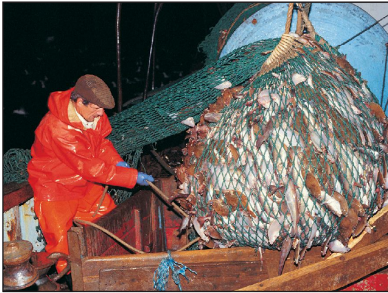
Ձկնորսությունը Հյուսիսային ծովում

Ներքին փոխադրումները կատարվում են ավտոմոբիլային և երկաթուղային տրանսպորտով: Մեծ Բրիտանիան ավտոճանապարհների խտությամբ աշխարհում առաջին տեղերից մեկն է գրավում: Երկաթուղային տրանսպորտի դերը մեծացավ, երբ Պա դե Կալե նեղուցի տակ կառուցված թունելով Լոնդոնը